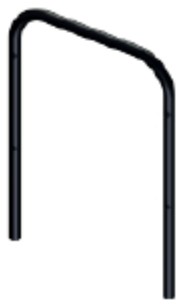
Стойка - 2 шт